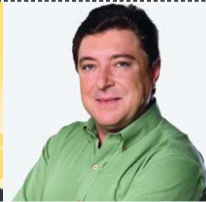
Carlos Grana prefeito Santo André (PT)