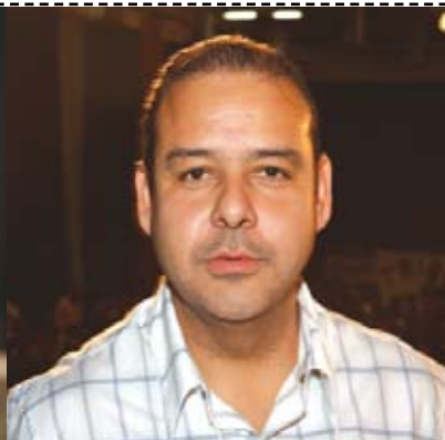
Wagner Freitas presidente da CUT Nacional