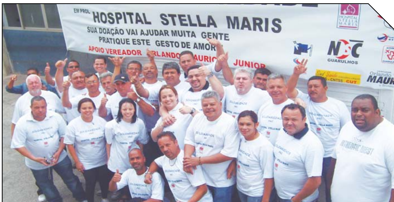
Mutirão do NSC em defesa do Hospital Stella Maris

Os sindicatos participantes do NSC representam uma base de cerca de 50 mil trabalhadores. As ações do Núcleo têm beneficiado cerca de 32 bairros de Guarulhos, onde residem 500 mil pessoas. J:➔